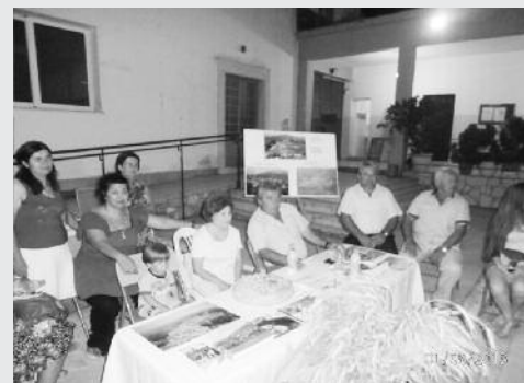
Το περίπτερο Χρυσοχωρίου - Μακίστου

Στις 31 Ιουλίου και 1 Αυγούστου 2013 στην αυλή του Δημοτικού Σχολείου Ζαχάρως πραγματοποιήθηκε εκδήλωση των Συλλόγων της περιοχής μας, με θέμα την προώθηση και διατήρηση της παραδοσιακής οικονομίας και πολιτιστικής κληρονομιάς του τόπου μας.