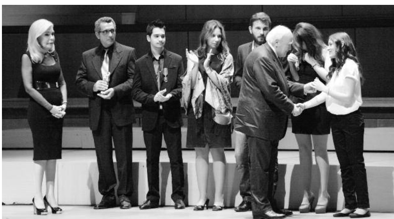
Ο Πρόεδρος της Δημοκρατίας κ. Κάρολος Παπούλιας παρουσία της κ. Μαρίας Βαρδή Βαρδινογιάννη απονέμει το Αριστείο «ΕΛΠΙΔΑΣ» στον κ. Αντώνη Φωτιάδη και τα Παράσημα «ΕΛΠΙΔΑΣ» στα πέντε παιδιά Αντώνη Φωτιάδη, Χριστίνα Φυτιλή, Στέλιο Παπαδέλα, Μαρία Μπούσια και Έφη Βλάμη

Στις 16 Οκτωβρίου 2013 στο Μέγαρο Μουσικής έγινε εκδήλωση από το Σύλλογο «ΕΛΠΙΔΑ» για την συμπλήρωση 20 ετών λειτουργίας της μονάδας μεταμόσχευσης μυελού των οστών. Στον Σύλλογο Μακιστাইών έγινε η τιμή να προσκληθεί στην εκδήλωση, όπου και παρευρέθηκε ο Πρόεδρος μας ως εκπρόσωπός του.