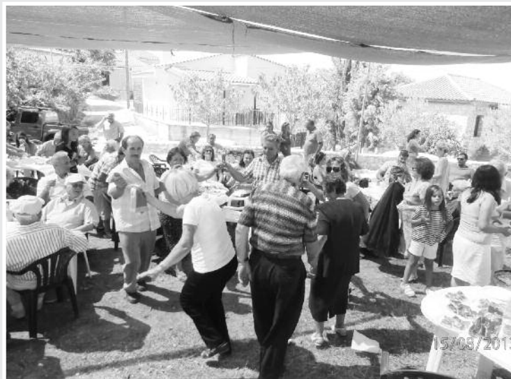
Στη γιορτή του Δεκαπενταύγουστου χορεύουμε