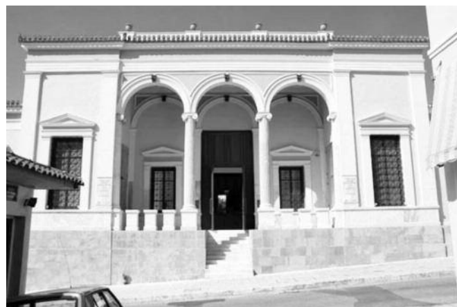
Η κεντρική είσοδος του Μουσείου