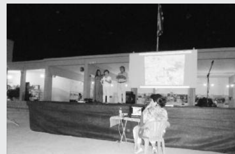
Οι Πρόεδροι Χρυσοχωρίου και Μακίστου Τούλα Κυριακοπούλου και Φώτης Βλάχος αντίστοιχα παρουσιάζουν το βίντεο για το Αίψυ

Καλό είναι, λοιπόν, να γίνονται τέτοιες εκδηλώσεις και να μετέχουμε σε αυτές, γιατί μόνο έτσι από κοινού θα μπορέσουμε να επιτύχουμε και να προσφέρουμε πολλά καλά στον τόπο μας.