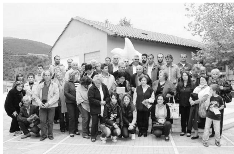
Οι εκδρομείς μπροστά από το Συνεδριακό Κέντρο Ανάβρας

Στην είσοδο του χωριού υπήρχε ποτάμι που οι κάτοικοι πετούσαν ότι άχρηστο είχαν και κυρίως τα ψόφια ζώα τους. Σήμερα στην ίδια έκταση, σε μια απόσταση περίπου τα 1.100 μ. έχει διαμορφωθεί ένα περιβαλλοντικό πάρκο, που ξεκινούν από παντού να το επισκεφθούν και σε τίποτα δε θυμίζει τον παλιό σκουπιδοτόπο. Ο παλιός νερόμυλος, η νεροτριβή (ντριστελά), οι πηγές της Ανάβρας, το ποτάμι με τα γέρικα πλατάνια. Στην είσοδο υπάρχουν πινακίδες και οδηγίες προς τους επισκέπτες, πλακόστρωτα μονοπάτια δεξιά και αριστερά στο ποτάμι, που συνδέονται με γεφυράκια για διευκόλυνση των επισκεπτών. Σε όλη τη διαδρομή υπάρχουν διευκρινιστικές ταμπέλες για την κάθε χλωρίδα του πάρκου. Παιδικές χαρές, τουαλέτες, παγκάκια, κλπ. Ξεκουράζουν τους επισκέπτες για να μπορούν να συνεχίσουν τη διαδρομή μέχρι τέλους.