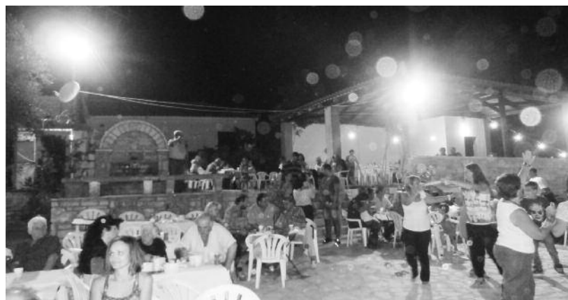
Οι Μακιστάρηδες και οι φίλοι τους χορεύουν

Από νωρίς άρχισε να μαζεύεται ο κόσμος. Μετρήσαμε πάνω από 600 άτομα. Προσφέρθηκε γουρουνοπούλα ψητή, γίδα βραστή, τραχανάς, παγωμένες μπίρες και αναψυκτικά.