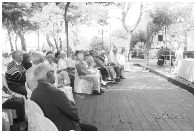
Η Γ.Σ. του Διαζώματος