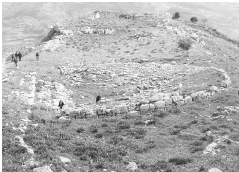
Το Αρχαίο Θέατρο στο Αίπυ

την χρηματοδότηση με 100.000 ευρώ της μελέτης αναστηλώσεως του Θεάτρου. Η μελέτη αυτή είναι απαραίτητη για να υποβληθεί στην Ευρωπαϊκή Ένωση με την αίτηση χρηματοδότησεως της αναστηλώσεως του