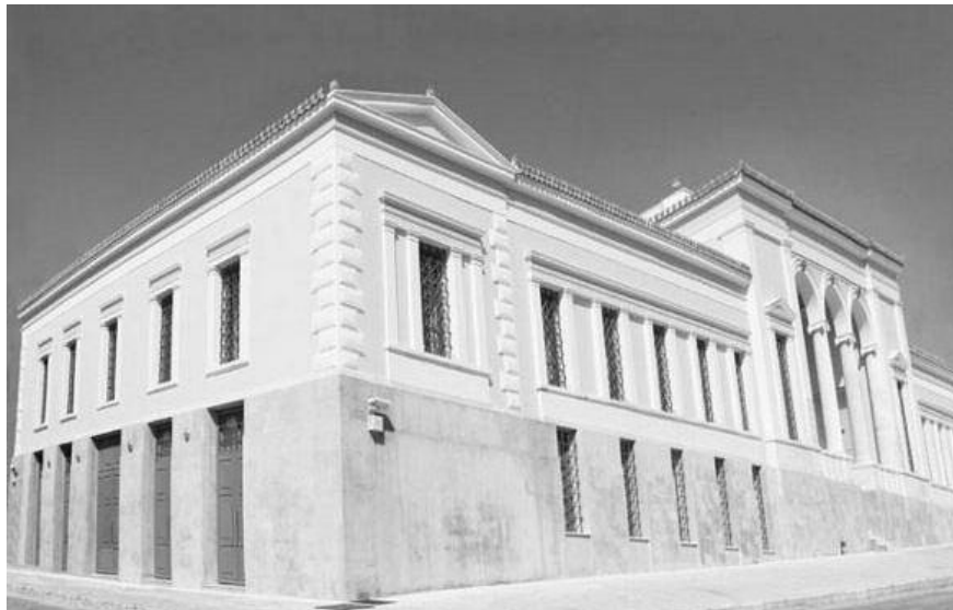
Μία άποψη του Αρχαιολογικού Μουσείου Πύργου

Με μεγάλη μας χαρά κατά την επίσκεψή μας το καλοκαίρι, στο τέλος της