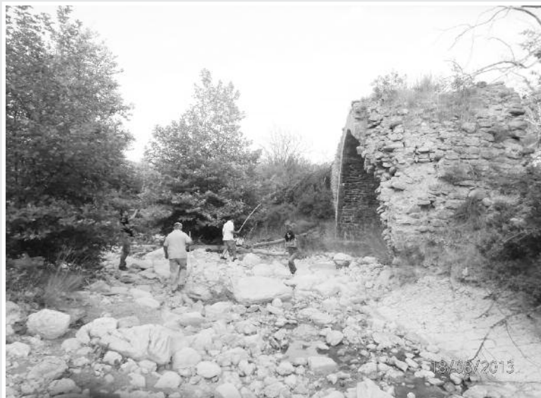
Ο ποταμός περνάει έξω από το γεφύρι και καταστρέφει το δυτικό πόδι του (κατά τους χειμερινούς μήνες)

χομένως του έτους κτίσης και των ονομάτων των πρωτομαστόρων, αλλά είναι δυσδιάκριτα.