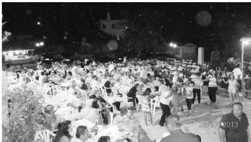
Μερική άποψη της πλατείας στο πανηγύρι